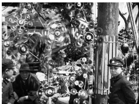
画像 1 『靖国神社春季大祭』