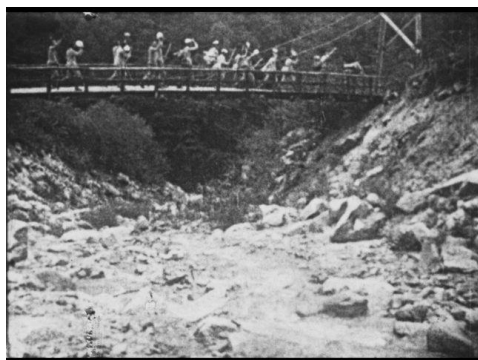
画像 5 『山の便り 海乃便里』