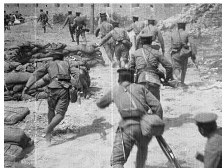
画像 2 『戦禍の済南』