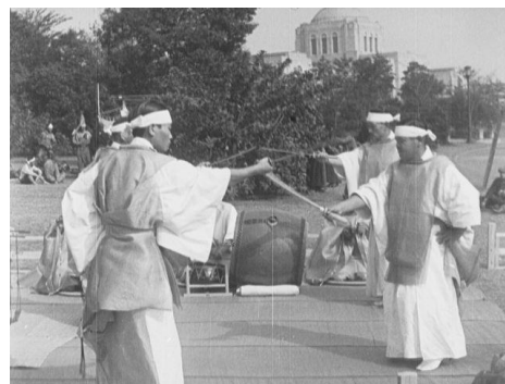
画像 4 『明治神宮 奉納神事舞』