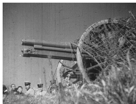
画像 6 『陸軍特別大演習 於岡山縣下 昭和五年十一月』