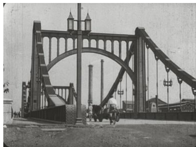
『復興帝都シンフォニー』（1929年）復興橋梁を代表する清洲橋

関東大震災によって壊滅的な被害を受けた東京の各地を、震災前に撮影された映像によって紹介し、栄華と繁栄を極め、威厳に溢れたかつての帝都の姿を懐古する。人込みに溢れた浅草六区の小屋に立つ幟から、撮影時期は1923年9月1日からあまり離れた時期ではないと思われる。