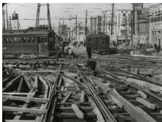
『帝都復興』（1930年）市電線路の移設風景

1929年10月19日から11月10日まで東京・日比谷公園内の市政会館で開催された帝都復興展覧会での上映を目的に、主催者の東京市政調査会が製作した記録映画。近代都市の諸相とそこで生きる人々の姿を、素早いモンタージュや大胆なアングルで切り取っていく手法は、当時世界各国の映画作家たちが取り組んだ「シティ・シンフォニー・フィルム」と称される映画群の影響をうかがわせる。