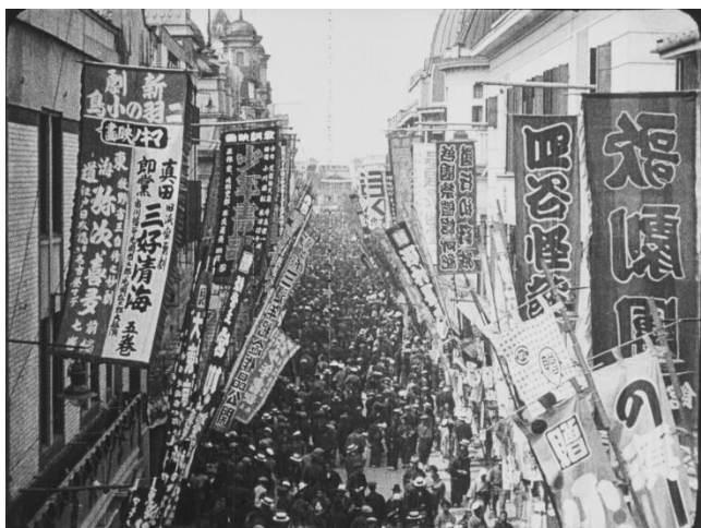
『大震災以前 帝都の壯観』（1925年）浅草六区・劇場街を埋める人込み