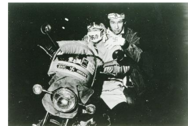
『ゴッド・スピード・ユー BLACK EMPEROR』