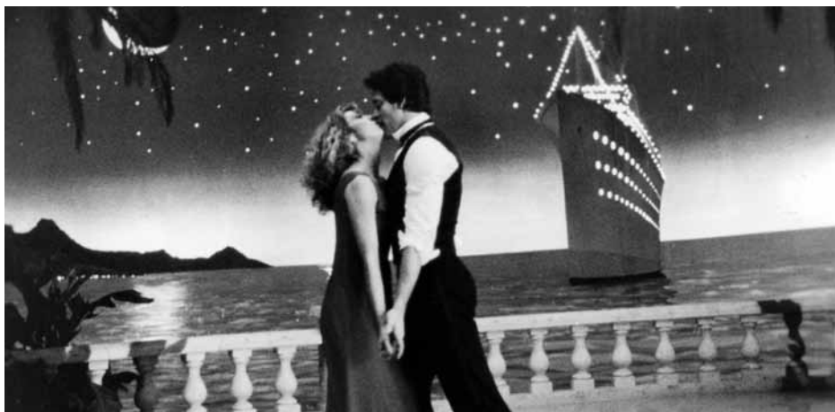
ワン・フロム・ザ・ハート

1992(ティノ・デ・ラウレンティス・コミュニケーションズ、ルネッサンス・ピクチャーズ) ⑤⑥サム・ライミ ⑦アイヴァン・ライミ ⑧ビル・ボブ ⑨トニー・トレンブレイ ⑩ジョゼフ・ロドッカ、ダニー・エルフマン ⑪ブルース・キャンベル、エンベス・デイヴィッツ、マーカス・ギルバート、イアン・アバウロンビー、リチャード・グローヴ、ブリジット・フォンダ