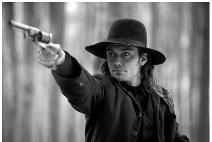
コールドマウンテン