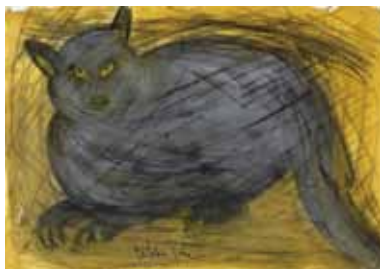
『ピストルオペラ』(2004年、鈴木清順監督)より「野良猫」

NFAJ Digital Gallery NFAJデジタル展示室 Digital Gallery 下記ホームページからお入りください http://www.nfaj.go.jp/digital-gallery