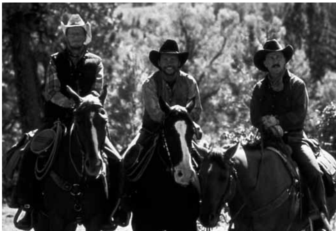
シティ・スリッカーズ

2003(ミラマックス・フィルムズ、ミラージュ・エンタープライズ、ボナ・ファイド・プロダクションズ) ◎◎アンソニー・ミンゲラ◎チャールズ・フレイジャー ◎ジョン・シール◎ダンテ・フェレティ◎ガブリエル・ヤレド、T・ボーン・バーネット◎ジュード・ロウ、ニコール・キッドマン、レナー・ゼルウィガー、ブレンダン・グリーソン、フィリップ・シモア・ホフマン、ナタリー・ポートマン、ドナルド・サザーランド