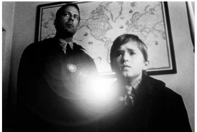
シックス・センス