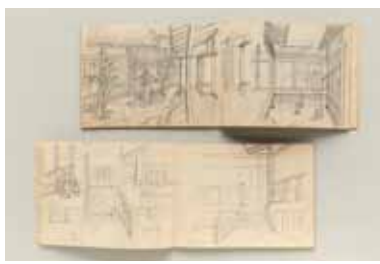
『春琴物語』(1954年、伊藤大輔監督)スケッチ帖