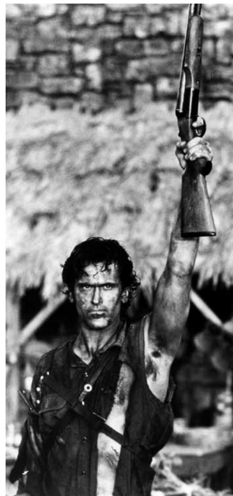
キャプテン・スーパーマーケット