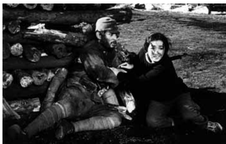
人間の条件 第五部・第六部