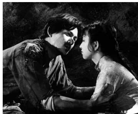
人間の條件 第一部・第二部