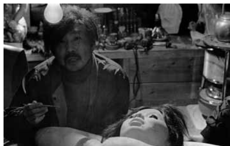
「エロ事師たち」より 人類学入門

1985(ディレクターズ・カンパニー)◎相米慎二◎加藤祐司◎伊藤昭裕◎池谷仙克◎三枝成章◎三上祐一、紅林茂、松永敏行、工藤夕貴、大西結花、会沢朋子、三浦友和、尾美としのり、鶴見辰吾、寺田農、小林かおり、石井富士子、佐藤允、伊達三郎