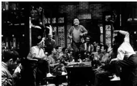
人間の条件 第三部・第四部

1961(にんじんくらぶ)◎小林正樹◎五味川純平◎松山善三、稲垣公一◎宮島義勇◎平高主計◎木下忠司◎仲代達矢、新珠三千代、中村玉緒、高峰秀子、川津祐介、笠智衆、内藤武敏、岸田今日子、腫麗子、諸角啓二郎、清村耕次、金子信雄