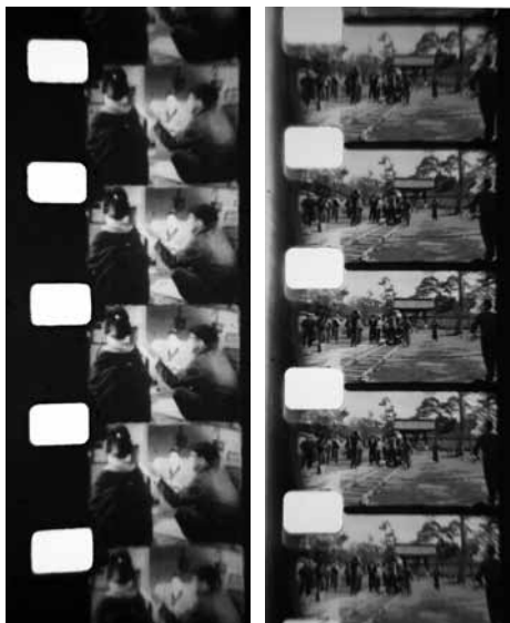
『情炎』撮影風景(左) 『柳生武芸帳』撮影風景(右)