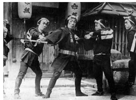
雷門大火 血染の纏

1953(大映京都)◎◎衣笠貞之助◎菊池寛◎杉山公平◎伊藤藤雄◎芥川也寸志◎長谷川一夫、京マチ子、山形勲、黒川彌太郎、坂東好太郎、田崎潤、千田是也、清水将夫、石黒達也、植村謙二郎、清水元