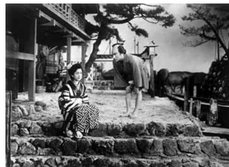
清水港 代参夢道中[『續清水港』改題短縮版]