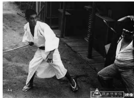
日本侠客伝 斬り込み