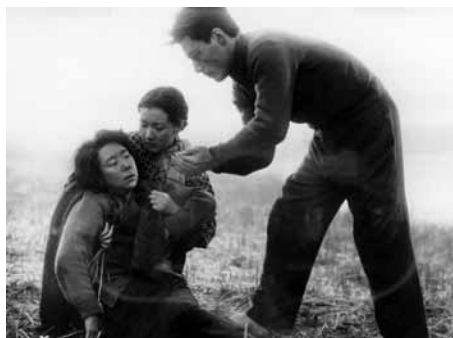
煙突の見える場所

1957(東宝)◎◎稲垣浩◎五味康祐◎木村武◎飯村正◎北猛夫、植田寛◎伊福部昭◎三船敏郎、鶴田浩二、久我美子、香川京子、岡田茉莉子、中村扇屋、大河内傳次郎、岩井半四郎、小堀明男、東野英治郎、平田昭彦、香川良介、戸上城太郎、上田吉二郎、左ト全、土屋嘉男