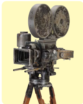
ミッチェルNC型撮影機