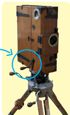
ウィリアムソン式和製撮影機