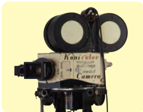
コニカラーカメラ

三原色をそれぞれ記録するため、フィルムを3本同時に使う大がかりなカメラ。1950年代に日本で開発され、使用されました。