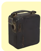
パテ・ベビー撮影機

三原色をそれぞれ記録するため、フィルムを3本同時に使う大がかりなカメラ。1950年代に日本で開発され、使用されました。