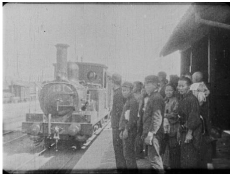
画像 1 『列車の到着』 動画：0:00～0:22