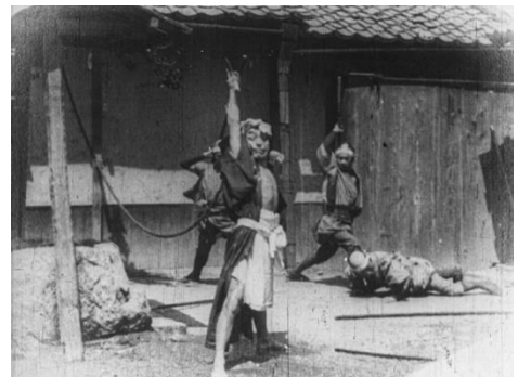
画像 4 『日本の俳優：剣による戦い』 動画：1:27～1:45