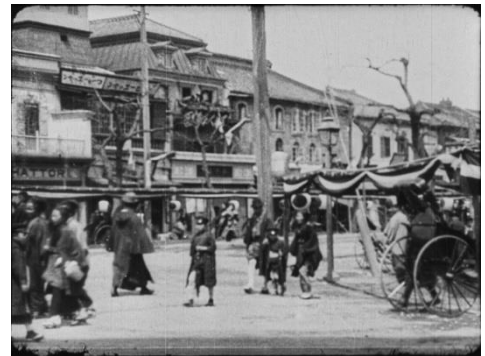
画像 6 『東京の通り II』 動画：2:19～2:46