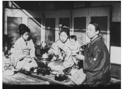
画像 2 『家族の食事』 動画：0:25～1:00