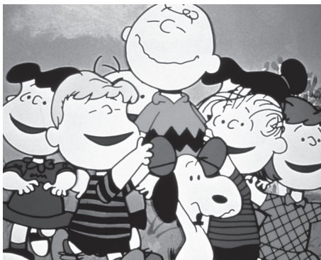
スヌーピーとチャーリー