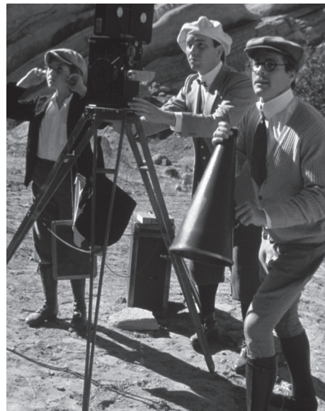
ニッケルオデオン