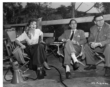
④『暴行』(1950年、アイダ・ルピノ監督)撮影中のアイダ・ルピノ (左)