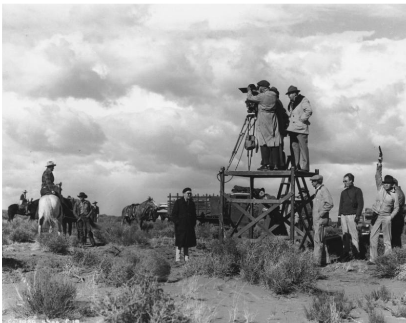
①『駅馬車』（1939年、ジョン・フォード監督）撮影中のジョン・フォード（中央）