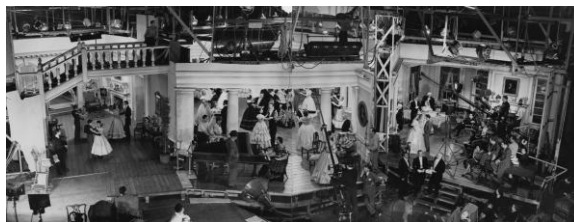
②『嵐が丘』(1939年、ウィリアム・ワイラー監督)撮影スナップ