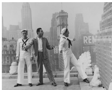
③『脱走大紐育』(1949年、スタンリー・ドーネン監督)撮影中の フランク・シナトラ(左)、スタンリー・ドーネン(中央)、ジーン・ ケリー(右)