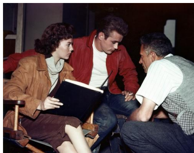
⑤『理由なき反抗』(1955年、ニコラス・レイ監督)撮影中のナタリー・ウッド(左)、ジェームズ・ディーン(中央)、ニコラス・レイ(右)