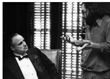
⑥『ゴッドファーザー』(1972年、フランシス・フォード・ Coppola 監督)撮影中のマーロン・ブランド(左)、フランシス・フォード・ Coppola(右)