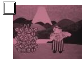
④『お関所』(1930 年) 監督：大藤信郎