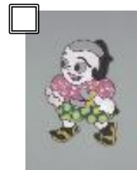
⑧大藤信郎のキャラクター 団子兵衛