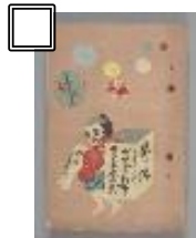
⑥大藤信郎 『だんごの行方』(1937 年)台本