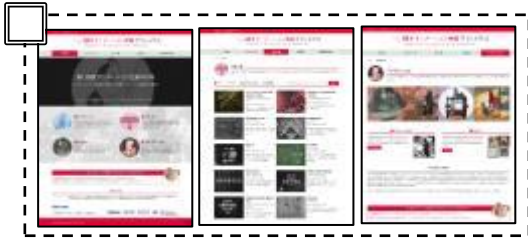
①ウェブサイト使用イメージ