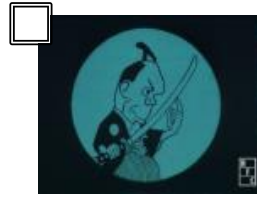
②『なまくら刀』[デジタル復元・最長版][白黒ボジ染色版] (1917 年) 監督：幸内純一 原版協力：松本夏樹