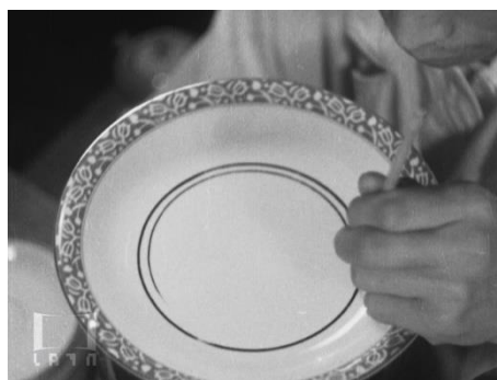
画像 4 『硬質陶器』 動画：1:42～2:15