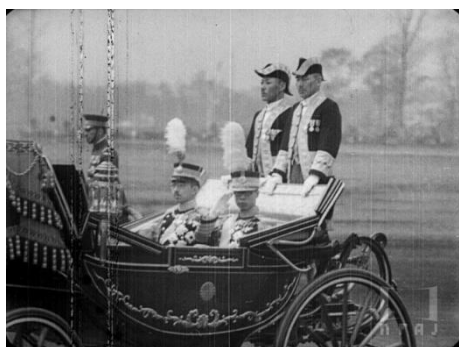
画像 3 『満洲國皇帝陛下御訪日』 動画：1:08～1:39