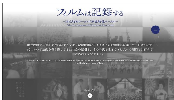
WEB サイト TOP イメージ