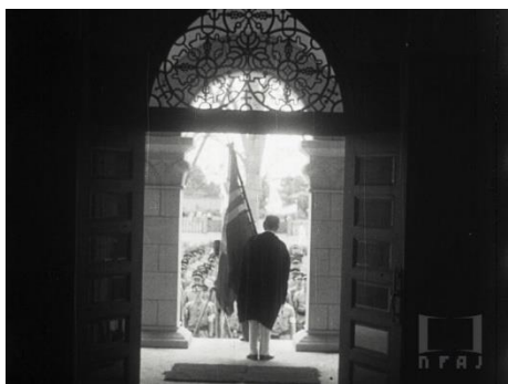
画像 5 『本郷より駒場への移轉式 皇紀二千五百 九十五年九月十四日』 動画：2:18～3:02