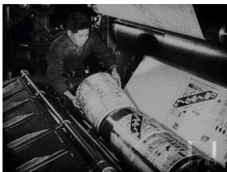
画像 1 『朝日は輝く【抜萃】』 動画：0:00～0:34