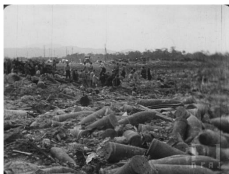
画像 2 『枚方陸軍倉庫爆破』 動画：0:37～1:05