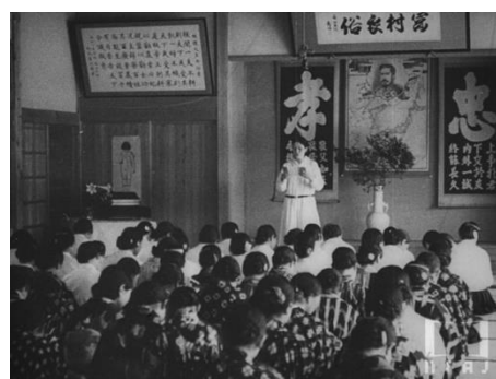
画像 6 『奈良縣田原村』 動画：3:05～3:52