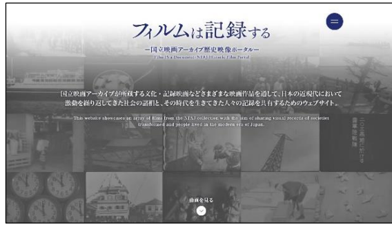
WEB サイト TOP イメージ