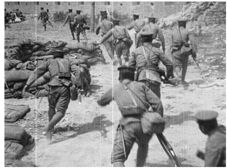
画像 2 『戦禍の濟南』 動画：0:35~1:13