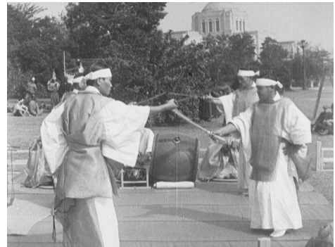
画像 4 『明治神宮 奉納神事舞』 動画：1:45~1:59