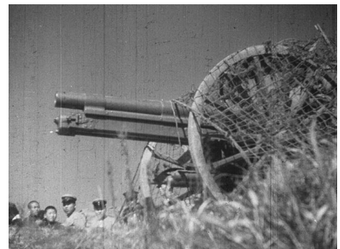
画像 6 『陸軍特別大演習 於岡山縣下 昭和五年十一月』 動画：2:41~3:18

【送付先】 国立映画アーカイブ「フィルムは記録する」広報担当 電話：03-3561-0823／FAX：03-3561-0830 E-mail：fiad@nfaj.go.jp