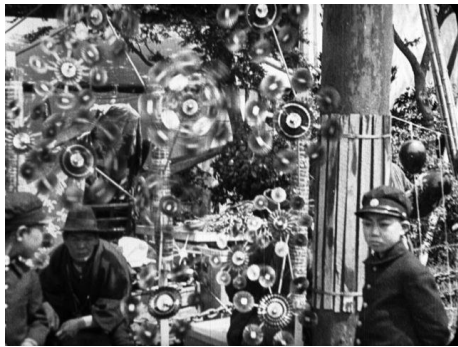
画像 1 『靖国神社春季大祭』 動画：0:00~0:33