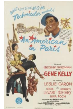
『巴里のアメリカ人』