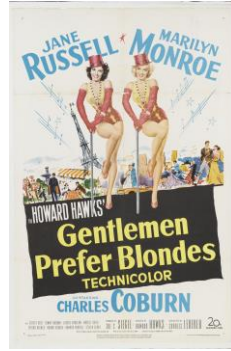
『紳士は金髪がお好き』