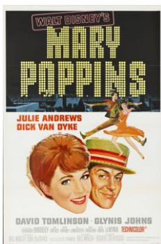
『メリー・ポピンズ』