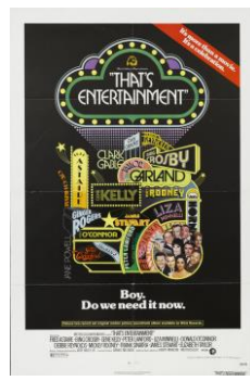
『ザッツ・エンタテインメント』