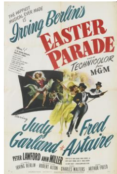
『イースター・パレード』