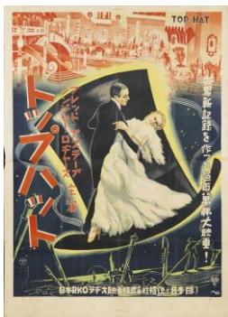
『トップ・ハット』（日本版）