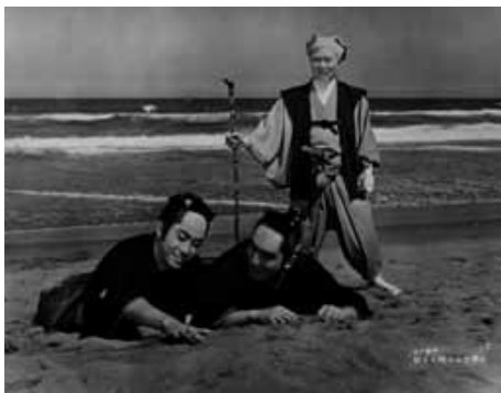
水戸黄門 助さん格さん大暴れ

1962(東映京都)◎河野寿一◎尾崎士郎◎結束信二、高橋稔◎森常次◎塚本隆治◎鈴木静一◎大友柳太郎、大川恵子、山東昭子、近衛十四郎、品川隆二、本郷秀雄、小田部通麿、津村礼司、北龍二、三島雅夫、水野浩、安井昌二、堺駿二、清川荘司、国一太郎、加藤浩、矢奈木邦二郎