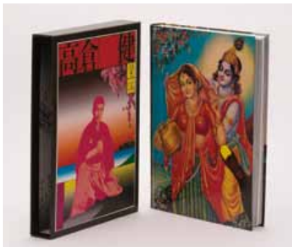
横尾忠則編「憂魂、高倉健」(2009年復刻版)