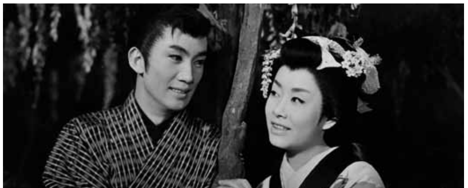
お染久松 そよ風日傘

1959(東映京都)◎マキノ雅弘◎比佐芳武、村松道平◎伊藤武夫◎吉村晟◎鈴木静一◎大友柳太郎、大川恵子、喜多川千鶴、山形勲、加賀邦男、三島雅夫、堺駿二、田崎潤、阿部九州男、浪花千栄子、住田知仁、梶すみ子、戸上城太郎