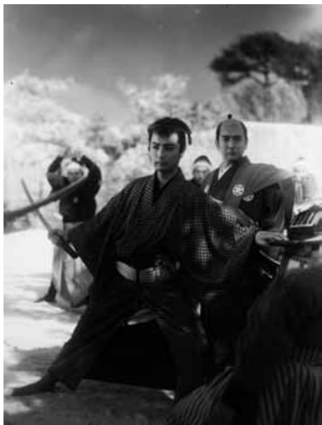
侍ニッポン 新納鶴千代

1958(東映京都)◎松田定次◎比佐芳武◎川崎新太郎◎川島泰三◎深井史郎◎片岡千恵蔵、中村錦之助、大川橋藏、東千代之介、長谷川裕見子、千原しのぶ、花柳小菊、伏見扇太郎、植木千恵、尾上鯉之助、大友柳太朗、大河内傳次郎、月形龍之介、市川右太衛門