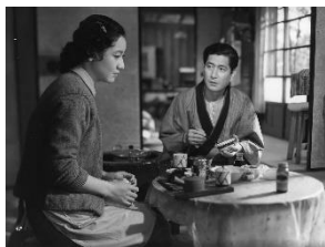
『 驟雨 』（斎藤一郎 作曲）

さらに当館初の試みとして、5月25日（土）に当館上映ホールを会場とした演奏会を開催します。黄金時代の映画を彩った音楽で構成された、バラエティに富むプログラムにご期待ください。