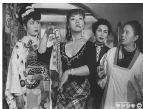
『 赤線地帯 』（黛敏郎 作曲）