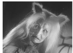
『 亡霊怪猫屋敷 』（渡辺宙明 作曲）