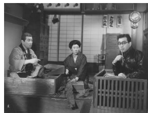
『 暖簾 』（真鍋理一郎 作曲）