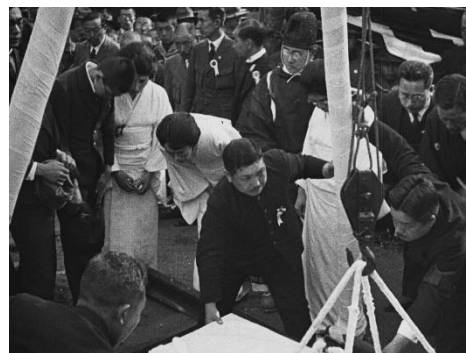
画像 4 『後藤伯爵葬儀』 動画：1:50~2:18