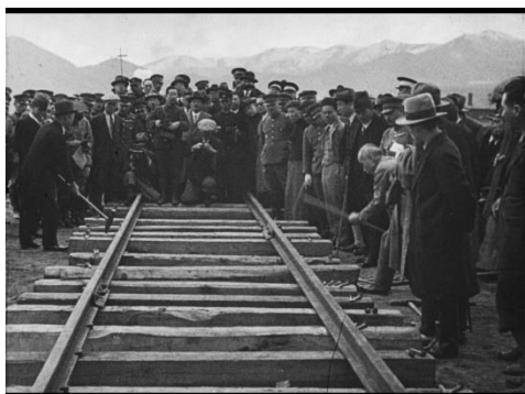
画像 5 『前線』 動画：2:22~2:57