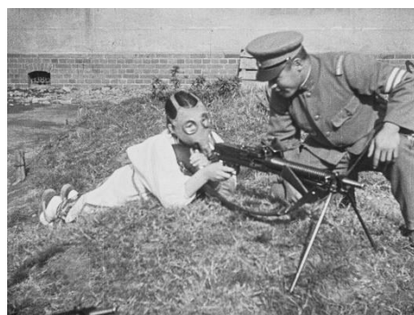
画像 6 『大日本国防婦人會 映画報 昭和九年十二月』 動画：3:01~3:23

【送付先】 国立映画アーカイブ「フィルムは記録する」広報担当 電話：03-3561-0823/FAX：03-3561-0830 E-mail：fiad@nfaj.go.jp