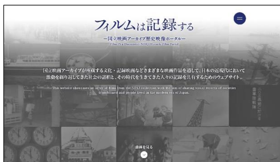
WEB サイト TOP イメージ