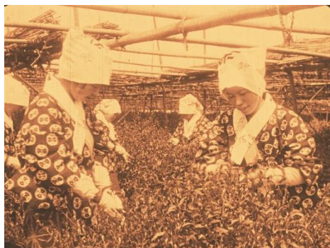
画像 3 『To the Sunny East』 動画：1:15~1:46