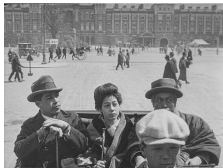
画像 2 『公衆作法 東京見物』 動画：0:31~1:11