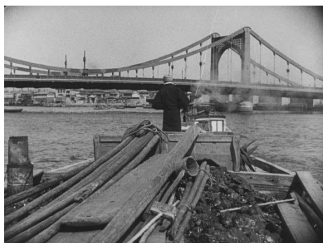
画像 1 『隅田川』 動画：0:00~0:28