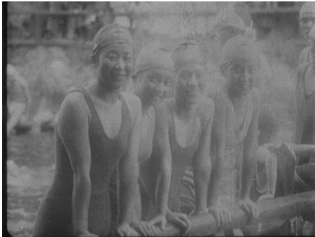
動画：00:45～ 作品クレジット： 『女子の運動』（1924年）