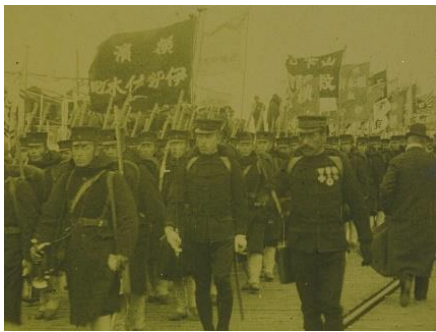
動画：00:00～ 作品クレジット： 『旅順の降伏』[NFC版]（1904-1905年）