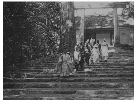
動画：00:21～ 作品クレジット： 『東宮同妃兩殿下 神宮竝山陵御参拜』（1924年）