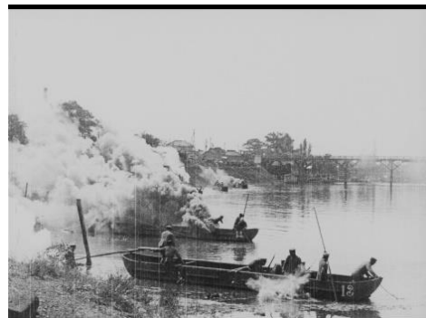
動画：01:53～ 作品クレジット： 『烟幕ヲ利用スル 敵前渡河 大正十一年九月二十五日』（1922年）