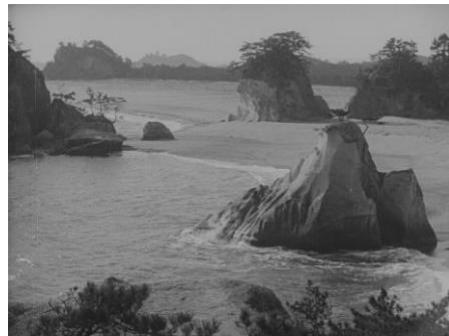
動画：00:59～ 作品クレジット： 『雪の松嶋』（1925年）