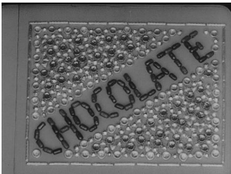
動画：01:29～ 作品クレジット： 『菓子と乳製品』（1926年） 協力：株式会社明治