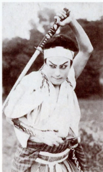
247(「高杉晋作」右太プロ、1928[昭3]年)