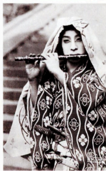
169(市川百々之助「牛若丸」帝キネ、1925[大14]年)