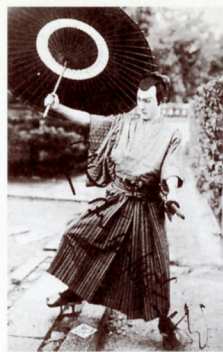
254(「仁俠二刀流」マキノ、1927[昭2]年)