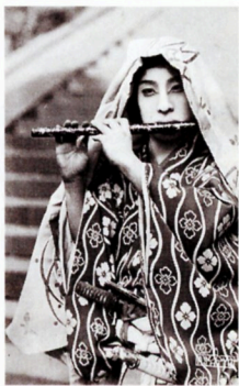
169(市川百々之助「牛若丸」帝キネ、1925[大14]年)