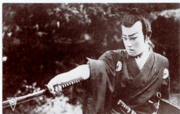
242(「鳴門秘帖」マキノ、1927[昭2]年)