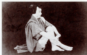
263(「切られ与三」松竹、1928[昭3]年)