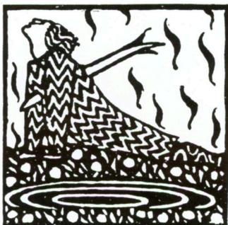
「ニーベルンゲン 第1部 ジークフリート」1924年

カール・オットー・チェシュカ、ゲルラッハ青少年文庫版「ニーベルンゲン」の挿絵 1909年