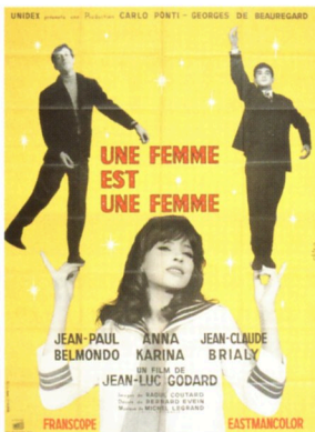
『女は女である』ポスター