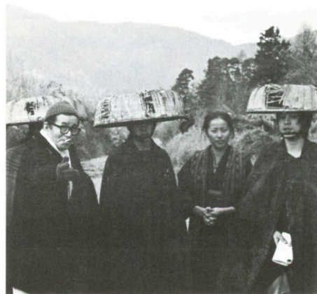
「股旅」演出中の市川崑監督