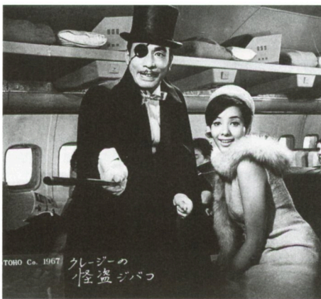
クレージーの怪盗ジバコ