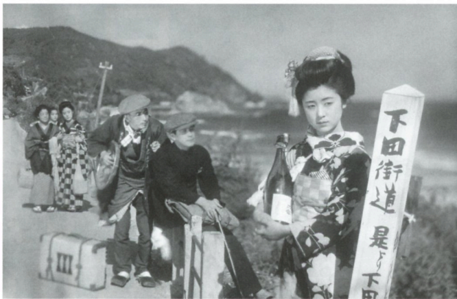
恋の花咲く 伊豆の踊子(1933年、五所平之助監督)

'74(東宝=ホリプロ) 監西河克己 脚若杉光夫 装萩原憲治 出佐谷晃能 出高田弘 山口百恵、一の宮あつ子、三浦友和、中山仁、千家和也