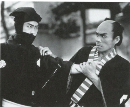
鞍馬天狗 江戸日記