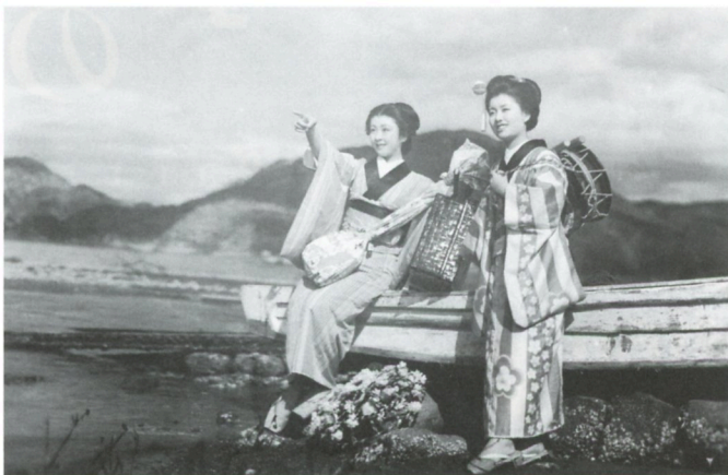
伊豆の踊子(1954年、野村芳太郎監督)