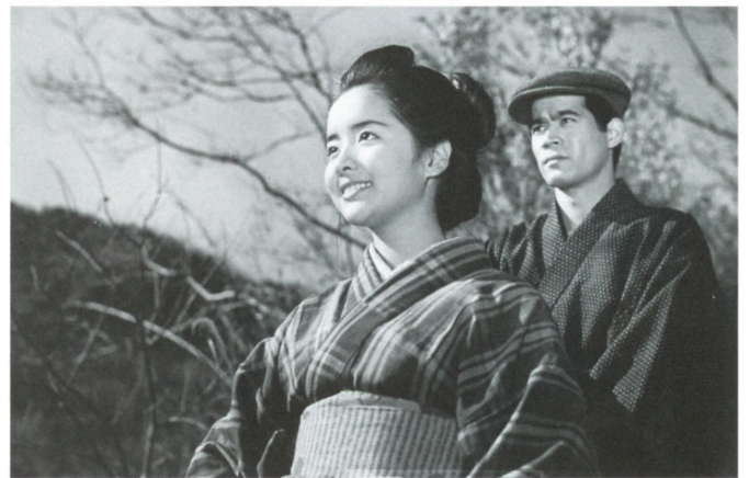
伊豆の踊子(1967年、恩地日出夫監督)