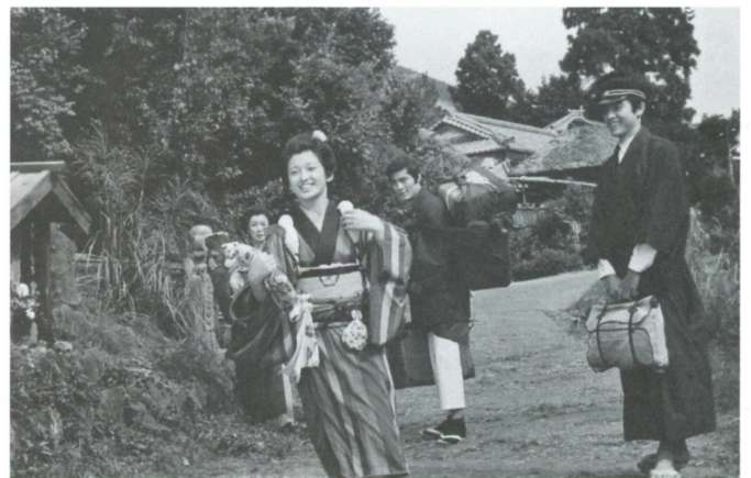
伊豆の踊子(1974年、西河克己監督)