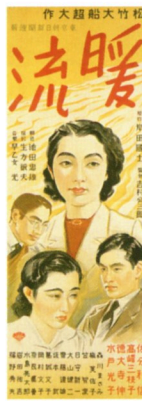
岸田國士『暖流』 (1939年、吉村公三郎監督) ポスター

フィルムセンターが所蔵する映画ポスター、スチル写真や脚本などを通して、映画がいかに日本のさまざまな文学作品を糧に生み出されてきたかをたどります。このシリーズ第2回では、昭和のはじめから終戦期までに主に活躍した作家の原作による映画作品に焦点を当てます。