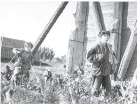
タシケントはパンの町