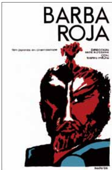
『赤ひげ』キューバ版(1966年) ポスター: エドゥアルド・ムニョス・パッチ

NFC Dig NFAJ デジタル展示室 Digital Gallery 下記ホームページからお入りください http://www.nfaj.go.jp/digital-gallery