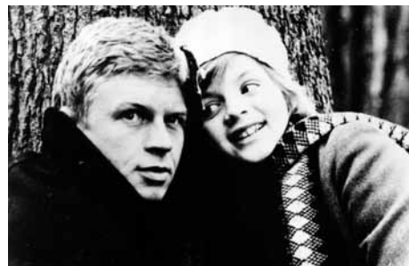
シベールの日曜日

1995(水の中の八月)製作委員会◎石井聰互◎笠松則通◎林田裕至◎小野川浩幸、松尾謙二郎、長尾寛幸、柏木省三◎小嶺麗奈、青木伸輔、宝井誠明、戸田菜穂、天本英世、植崎弥之助、町田町蔵、大須賀真、松尾れい子