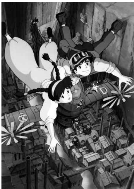
天空の城ラピュタ