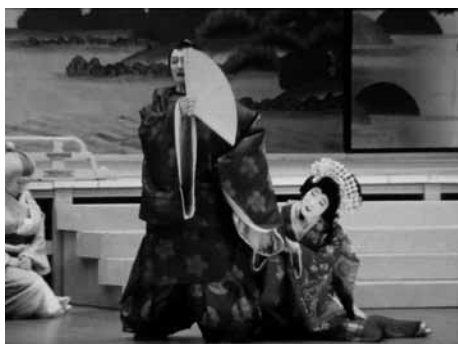
歌舞伎役者 片岡仁左衛門 人と芸の巻 中巻