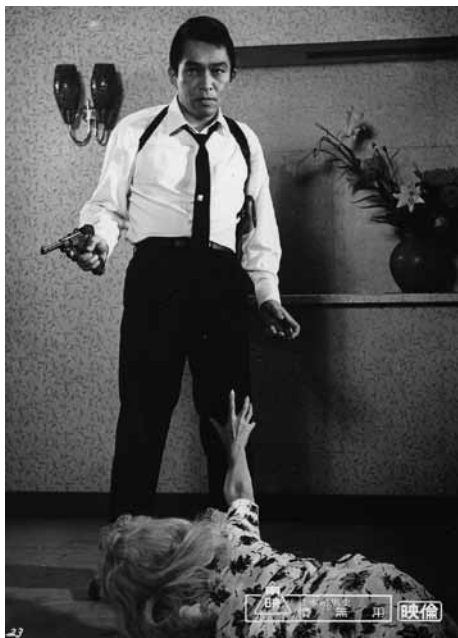
日本暗黒史 情無用