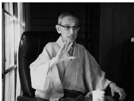
歌舞伎役者 片岡仁左衛門 登仙の巻

1961(佐川プロ)◎山際永三◎秋本マサミ◎山田健◎岡田公道◎宮沢計次◎林光、萩原秀樹◎星輝美、松原緑郎、藤木孝、奈良あけみ、柏木優子、鳴門洋二、沢村みつ子、利根はる恵、秋本マサミ、中岡慎太郎、大谷にお