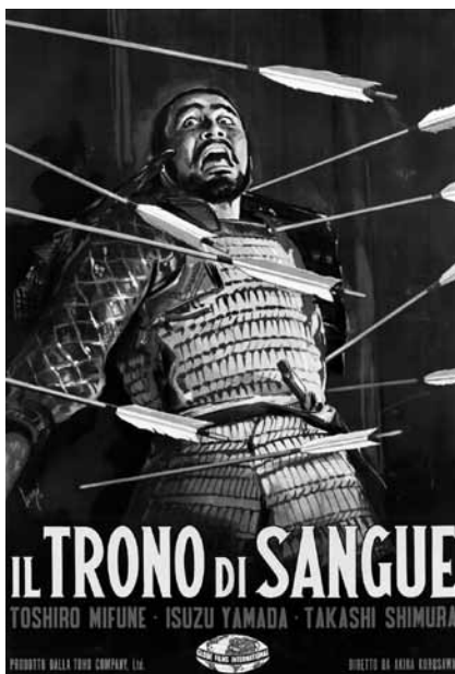
『蜘蛛巣城』イタリア版[2シート判] (1959年) ポスター：カルラントニオ・ロンジ