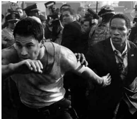
ホワイトハウス・ダウン

2011(SBSプロダクションズ=コンスタンティン・フィルム=SPIフィルム・スタジオ=ヴェルサティル・シネマ=ザナガル・フィルムズ=フランス・ドゥ・シネマ)●ロマン・ポランスキー●ヤスミナ・レザ●パヴェウ・エデルマン●デューン・タヴォウリス●アレクサンドル・デスプラ●ジョディ・フォスター、ケイト・ウィンスレット、クリストフ・ヴァルツ、ジョン・C・ライリー