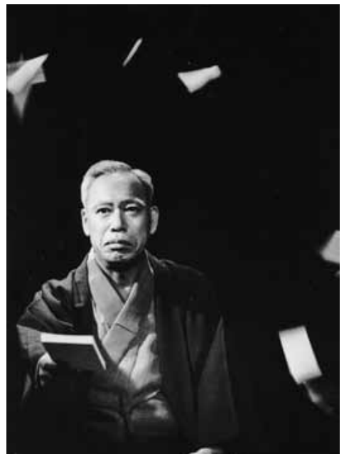
總會屋錦城 勝負師とその娘